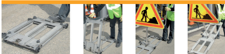
Facilité de déverrouillage au pied