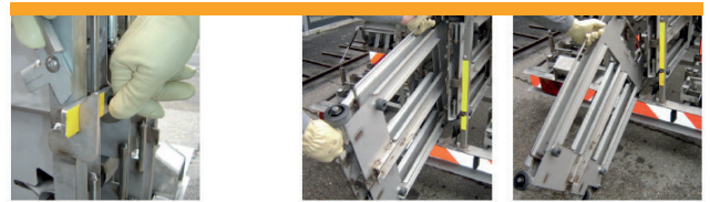
Système de verrouillage simplifié